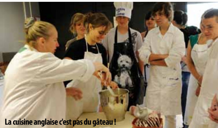
La cuisine anglaise c'est pas du gâteau !

"Cette expérience et cette formule sont géniales ! Les élèves sont réceptifs même si certains sont timides. Il y en a qui adorent l'anglais, d'autres qui sont ici pour améliorer leur niveau... Le plus dur pour eux, c'est de parler devant les quatre intervenants anglais, ça les bloque un peu..."