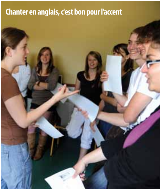
Chanter en anglais, c'est bon pour l'accent