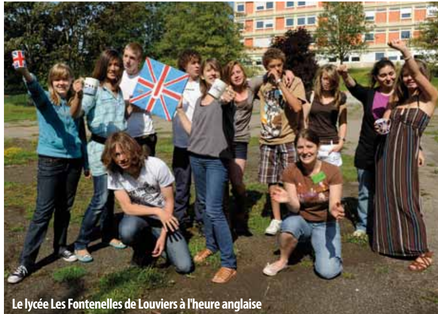
Le lycée Les Fontnelles de Louviers à l'heure anglaise