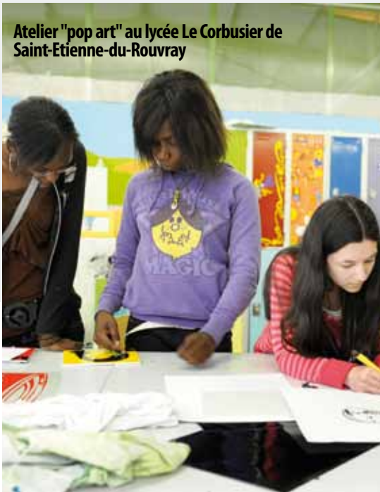
Atelier "pop art" au lycée Le Corbusier de Saint-Etienne-du-Rouvray

Dessin, cuisine, chant, jeux... la langue anglaise dans toutes ses versions