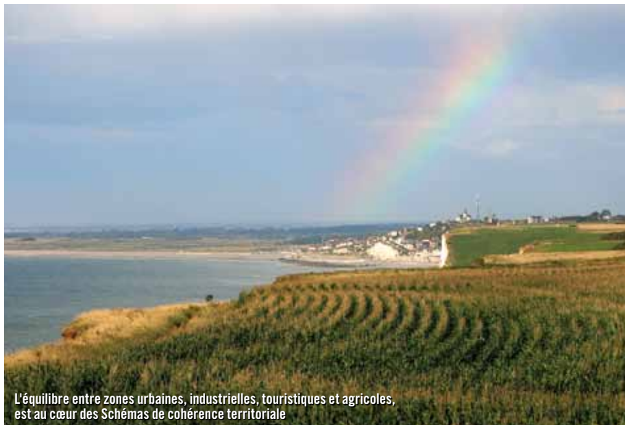
L'équilibre entre zones urbaines, industrielles, touristiques et agricoles, est au cœur des Schémas de cohérence territoriale

*Travaillant en réseau, le Groupe des SCOT haut-normands rassemble les responsables et animateurs des SCOT au sein du Centre de ressources du développement territorial ( www.territoires-haute-normandie.net )