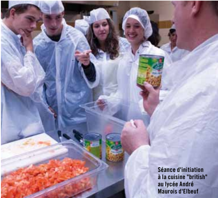
Séance d'initiation à la cuisine "british" au lycée André Maurois d'Elbeuf

Du 14 au 18 juin et du 28 juin au 2 juillet, la Région propose aux élèves de Seconde un stage intensif d'anglais "clés en main" : Région Langues. Cette année, plus de 700 jeunes Haut-Normands vont en bénéficier.