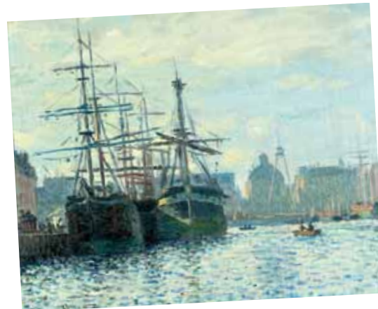
Claude Monet, Le bassin du Commerce, Le Havre, 1874.

Plus de 200 expositions, manifestations, animations dans toute la Normandie. Lire en pages 9, 10 et 11 de ce numéro le dossier consacré à l'événement. Programme complet du festival sur www.normandie-impressionniste.fr , dans les offices de tourisme, les musées et lieux publics.