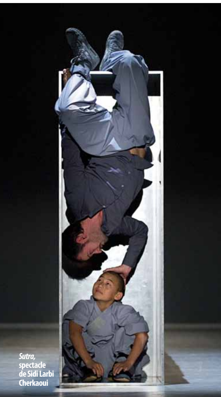
Sutra, spectacle de Sidi Larbi Cherkaoui

Valorisant 100% des déchets, le biogaz produit permettra de fournir de l'électricité pour 1 100 habitations et des fertilisants pour 1 500 hectares de production agricole (céréales, fourrage, lin). La mise en service de Capik est prévue en janvier 2011. ■