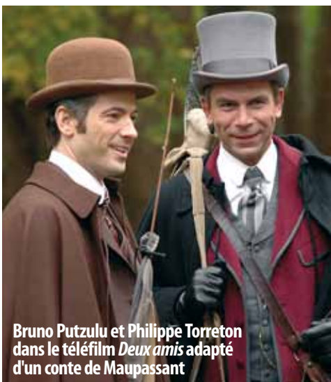
Bruno Putzulu et Philippe Torreton dans le téléfilm Deux amis adapté d'un conte de Maupassant

Elle attribue en effet chaque année une enveloppe d'environ 120 000 euros aux manifestations célébrant le 7 e art : le festival du cinéma nordique (Rouen, en mars), Cinéma et ruralité (Gournay-en-Bray, en mars), L'Europe autour de l'Europe (Bernay, en mars), A l'Est du nouveau (Rouen et Mont-Saint-Aignan, en mai), Les passerelles du cinéma (Dieppe, en juin), le festival du cinéma du monde (dans plusieurs villes de Haute-Normandie, en octobre), le festival du film d'éducation (Evreux, en novembre), Du grain à démoindre (Gonfreville l'Orcher, en novembre). ■