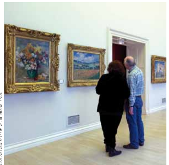
Musée des Beaux-Arts de Rouen

Contact : Région, service Transports, 02.35.52.56.41