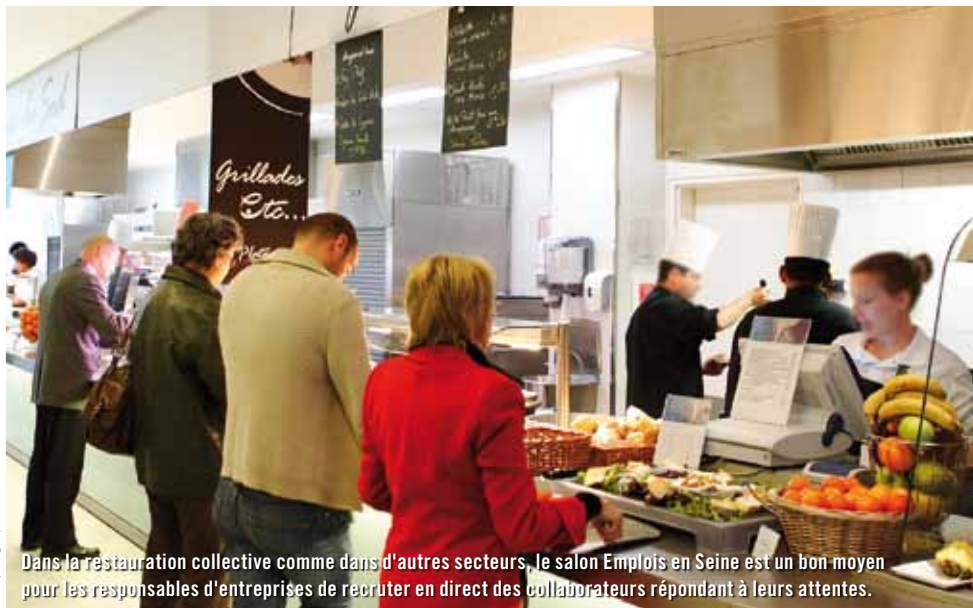
Dans la restauration collective comme dans d'autres secteurs, le salon Emplois en Seine est un bon moyen pour les responsables d'entreprises de recruter en direct des collaborateurs répondant à leurs attentes.

manières de recruter du groupe. "L'avantage par rapport aux candidatures que l'on reçoit sur notre site internet ou par courrier, soit spontanément soit en réponse à une annonce que nous avons passée, c'est que nous avons la personne en face de nous. Nous pouvons également apprécier sa manière de s'exprimer et sa personnalité." ■