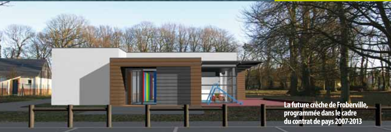
La future crèche de Froberville, programmée dans le cadre du contrat de pays 2007-2013

Signé le 9 décembre 2009, le contrat de pays des Hautes Falaises 2007-2013 mobilise un montant total de financements de 33,4 millions d'euros, dont le tiers provient de la coopération 276 (Région + Départements).