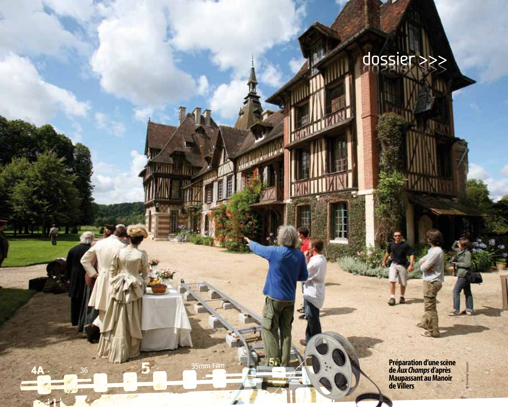
Préparation d'une scène de Aux Champs d'après Maupassant au Manoir de Villers