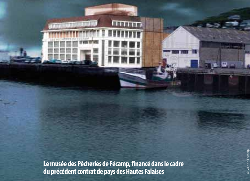
Le musée des Pêcheries de Fécamp, financé dans le cadre du précédent contrat de pays des Hautes Falaises